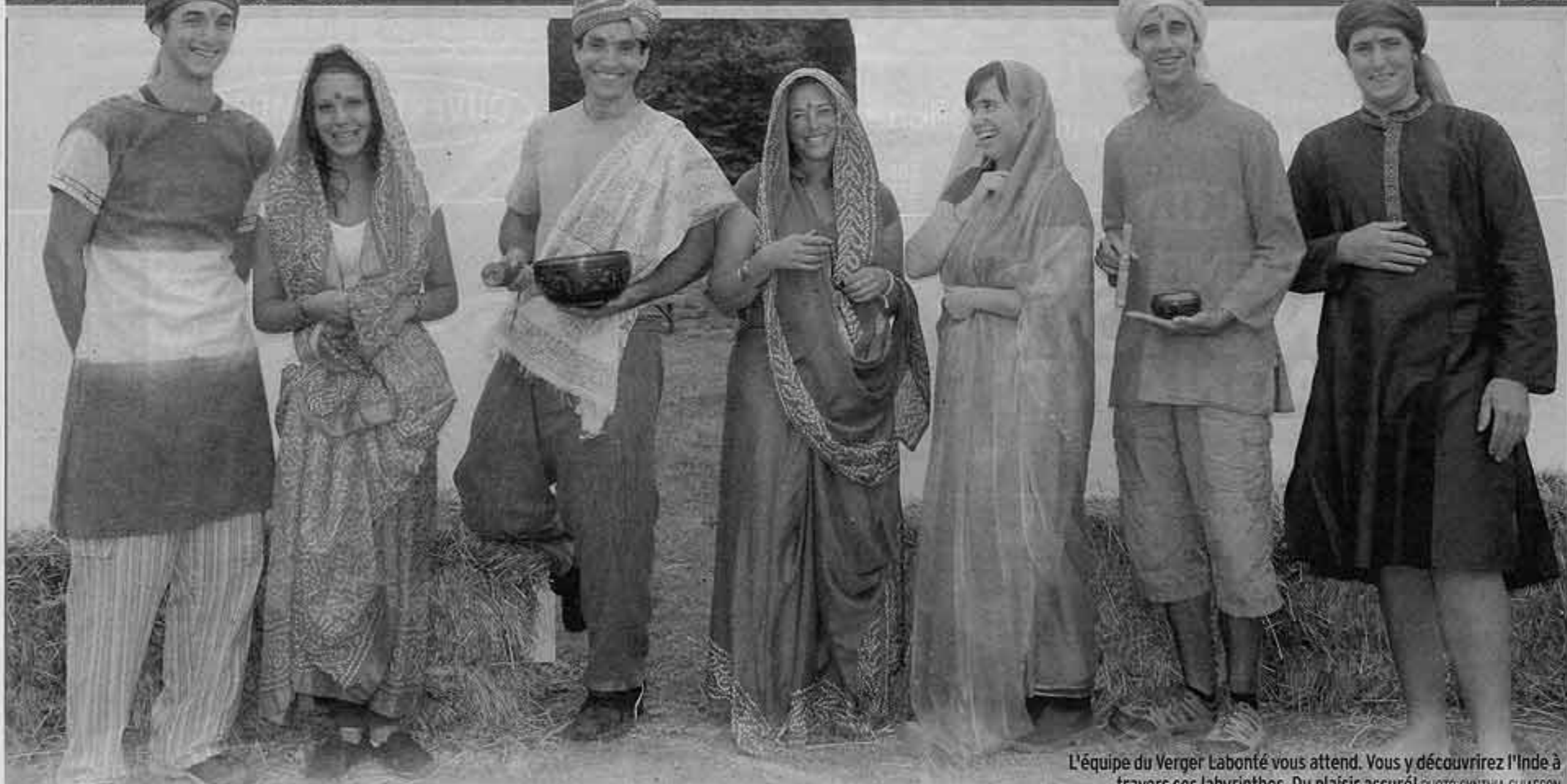
L'équipe du Verger Labonté vous attend. Vous y découvrirez l'Inde à travers ses labyrinthes. Du plaisir assuré!